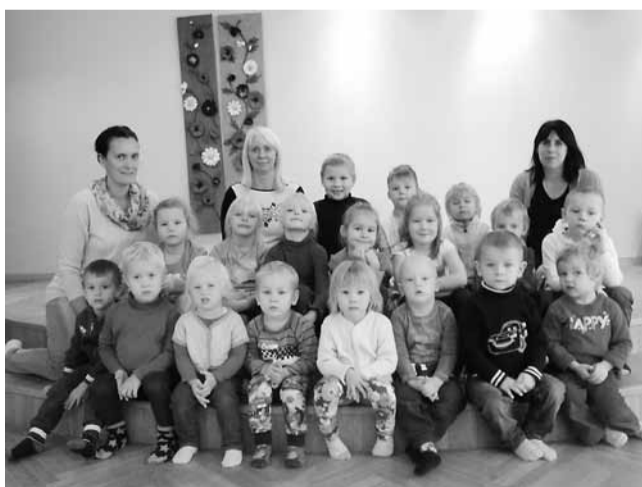
Viitina lasteaiarühm Puhhikesed.

Õpetajalt nõuab töö liitühmas pedagoogilist meisterlikkust. Tunnid ja tegevused tuleb läbi viia nii, et need pakuks midagi igale vanusele ja igal tasemel lastele. Selle süsteemi juures on äärmiselt oluline kogu meeskonna