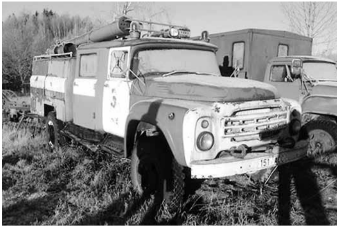
Luutsniku Pääste-Ennetuskeskuse auto enne uue elu algust.

Suviste tegemiste hulka mahtus ka MTÜ Luutsniku Pääste-Ennetuskeskus ametlik registreerimine ja Haanja vald ametliku koostöökokkuleppe sõlmimine. Selleks ajaks olid mehed koos tegutsedes jõudnud veendumuseni, et kui juba päästevärvide auto restaureeritakse ning leidub nii palju kaasaelajaid alates Haanja vallavalitsusest kuni erinevate ettevõtteni, siis tahetakse laiemale üldsusele ka midagi tagasi anda. Kuna puudub rahaline ressurss, kaasaegne tehnika ja (praegu veel) ka vastav väljaõpe, siis päris päästjatena vabatahtlikule päästele ei pühendata, küll aga ennetusele ning laste ja peredega seotud tegevustele: laagrid, vabaõhuüritused, kampaaniad... Tööpõld on lai ja huvitav. Autole on plaanis taotleda uunikumi mustad numbrimärgid, Eestis pole veel keegi niisugust masinat sellises