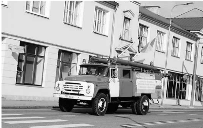
Pooleldi renoveeritud ZIL 130-63B selle aasta augustis Võru linna päevadel.