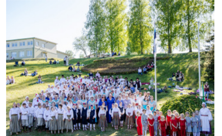
Rõuge Valla Rahvamaja kollektiivide suur kevadkontsert Varstus.

Üks hooaeg on taas möödas ja Rõuge Valla Rahvamaja kollektiivide kevadkontsert Varstus „mätal mäe pääl“ tehtud. Sellised suured peod sünnivad ainult ühte hoides. Lood, laulud ja tantsud, mis meie juhendajad tänavu endaga kevadkontserdile kaasa tõid, kõnelesid meie aja lugu, rääkides oma kodukoha armastusest, meie olulistest väärtustest, kuid puudutasid ka murekohti, avasid meie hingesoove ning paitasid hingepaelu. Imetleme oma lauljate, tantsijate ja pillimängijate võimeid suuta iseenast ja üks-teist motiveerida, igal nädalal kokku tulla ning koos laulda, tantsida ja pilli mängida. Oleme rõõmsad ja tänulikud teie kõikide üle ja pärast!