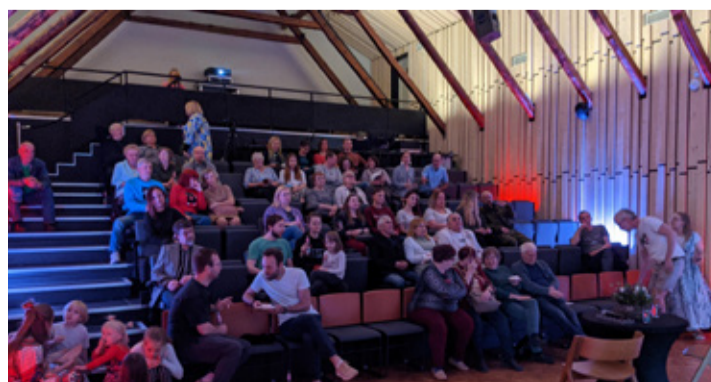
Rõõm on näha, et erinevad sündmused on meie majadesse toonud arvuka publiku.