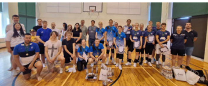
Terviseturniiri osalejad Misso rahvamajas. Fotolt puudub 5. koha saavutanud tiim Ässad.