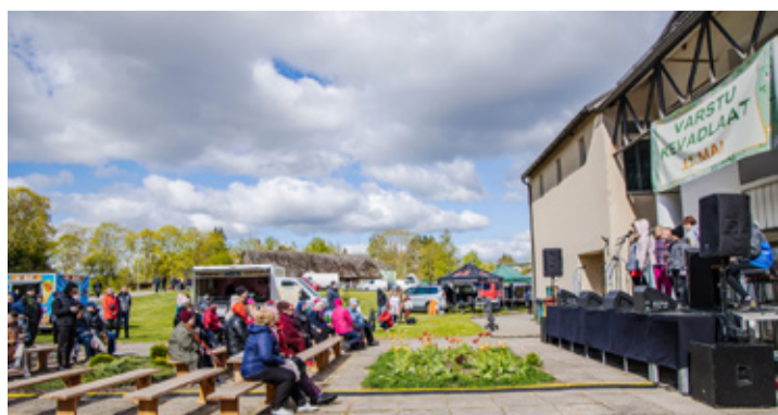
Varstu kevadlaad toimus taas pärast aastast pausi.

Rõuge Valla Rahvamaja kommunikatsioonijuht