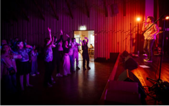
Ameerika indie-pop ansambli Sub-Radio kontsert Rõuge rahvamajas.

ja kino avalikku programmi. Lühifilmi „Ellujäämise kunstnikud“ kohta saab täpsemalt lugeda tartudok2024.ee/ellujäämise-kunstnikud