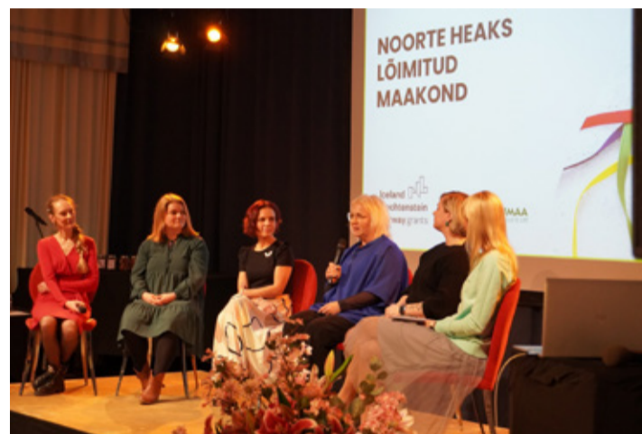
Paneelarutelu kohalike omavalitsuste spetsialistidega.