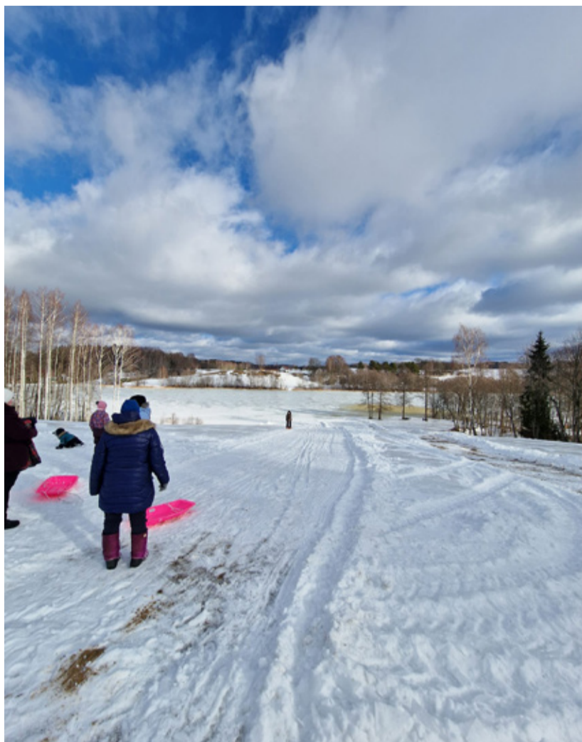
Nursi vastlad.

MTÜ Nursi Tegusad tänab kõiki osavõtjaid, kohtume juba tulevasel üritustel!