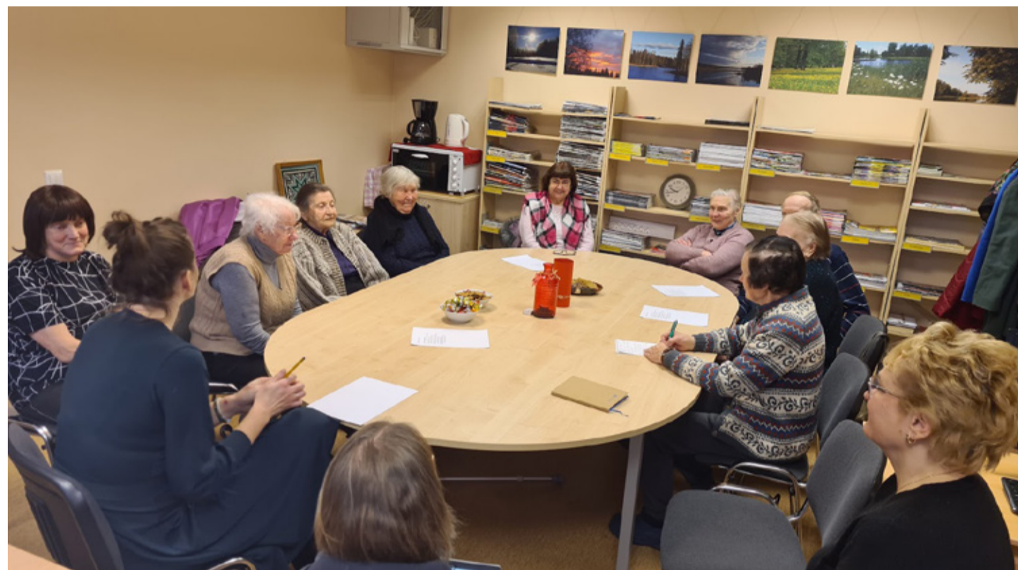
Hetk eakate kohtumiselt Mõniste raamatukogus.

Aruteludest jäi selgelt kõlama, et esinduskogu koosseisu liikmed tuleks määrata endiste valdade piirkondade kaupa, hõlmates Mõnistest, Varstust, Rõugest, Haanjast ja Missost pärit vanemaealisi.