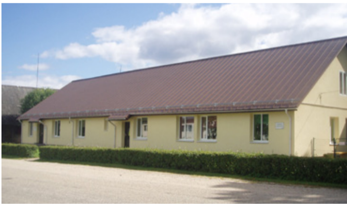
Varstu LA hoone.

taid tagasi oli lastele mängimiseks ka puidust laev.