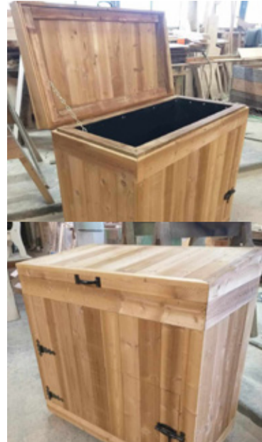
Rõuge ettevõtte OÜ Pargi Puukoda pakutavad kompostrid. Tutvu ettevõtte tegemistega Facebooki lehel Saematerjal, puidutoodete valmistamine ja huvi korral võta ühendust telefonil 523 8365.

saadaval valik kompostreid, kuid neid pole keeruline ka ise kodus valmistada. Kindlasti on Rõuge vallas hulk puutööd tegevaid ettevõtteid, kellega just oma vajadustele vastava kompostri valmistamises kokkuleppele saab.