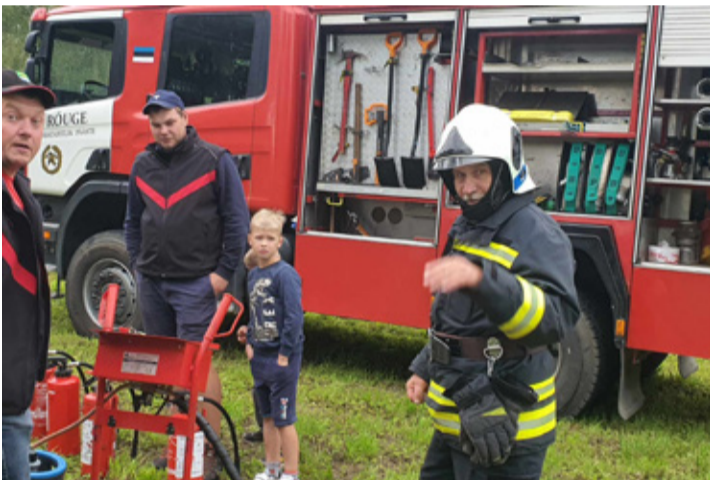
Augustilaadal jagasid õpetusi ohutustest Rõuge priitahtlikud pritsimehed.

tahte ja aja küla, et elu siin säiliks ja iga inimene saaks olla uhke oma koduküla üle. Aitäh!