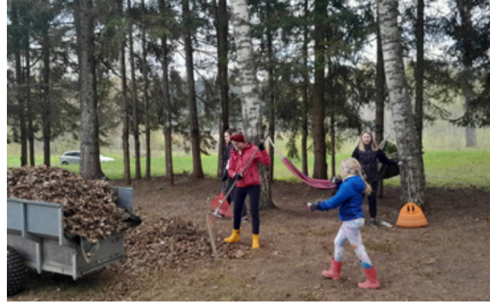
Talgutel korrastasime Nursi Magasiida ümbruse ja külaplatsi.

2023. aastal osales meie MTÜ Eesti võrkpalliliidu korraldatud taotlusvoorus „Võrguplatsid korda“. Nursi küla võrkpalliplats sai võidu ilma hääletuseta. Tänu tublide kogukonnaliikmetele ja Rõuge valla toetusele on meie küla võrkpalliplats nüüd uues kuues ja osales ka Rõuge Su-