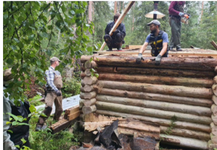
Suvel toimusid Lükka metsavendade punkri remonditööd.

vevolle sarjas. Suur tänu OÜ Kapeka tublitele töömeestele, kes võrguplatsi korda tegid!