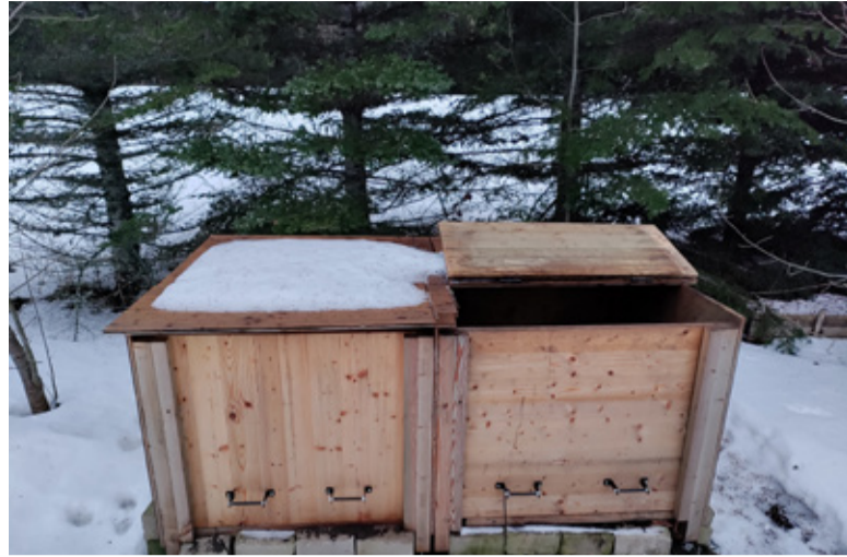
Haki talu pere omavalmistatud komposter.

■ Eramajapidamistel on kohustus anda tasuta ära segapakendeid. Selleks otstarbeks toob jäätmevedaja tasuta pakendiko-