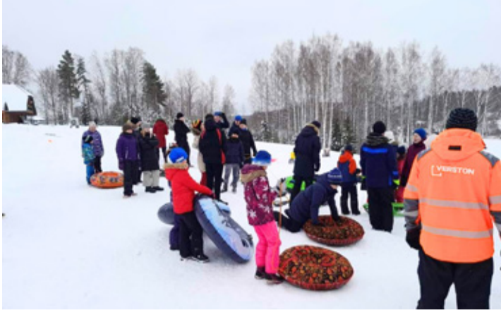
Vastlapäeval Kahrila järve mäel.

On tore tõdeda, et kogukonna inimene siiski hoolib ja vajab erinevaid ühisüritusi, kokkusaamisi ja toredat ajaveetmist. Täname kõiki, kes on vähemal või rohkemal määral panustanud Nursi külaelu arengusse ja tegemistesse, kes on andnud enda vaba