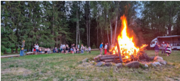
Jaanidel tuli kokku ligi 150 pidulist.