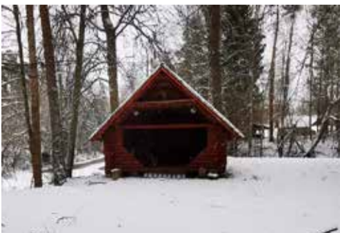
Karisöödi pargi kõlakoda

Karisöödi pargis asuva kõlakoja ette oleks vaja ehitada tänavakividest plats suurusega kuni 50 ruutmeetrit. Karisöödi park asub imeilusa Peeri jõe sopis, jõest on kanaliga eraldatud saareke, millel on Mõniste metskonna poolt rajatud kõlakoda koos tantsuplatsi ja pinkidega. Karisöödi park on oluline looduskaitse seisukohast, see pakub huvi ka loodussõpradele. Samuti on koht oluline kohalikule kogukonnale kokusaamiskohana ning korraldatud park annab võimaluse korraldada erinevaid kultuuriüritusi.