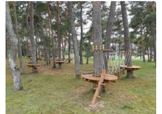
Pilt on illustratiivne

Asukoht mänguväljaku lähedal. Madalseikluspargid on oma olemuselt nagu mänguväljakud, aga mõeldud palju laiemale ringkonnale. Kuna seiklusparkides leiavad tegevust igas vanuses inimesed, siis on need suurepäraseks kohaks, kus perega koos aega veeta. Selliseid kohti kasutavad meelsasti ka möödasõitvad turistid (eriti lastega reisivaid turiste).