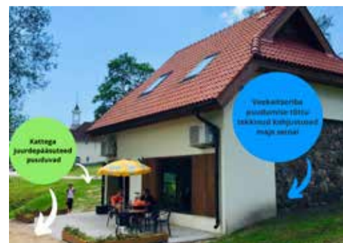
Ruusmäe noortekoja hoone

Veekaitseriba kaitseb hoonet veekahjustuste eest, jalgtee mõisa suunal teeb majade vahel liikumise mugavamaks ning parkla võimaldab noortekoda kasutada ka kaugemalt tulnud külastel.