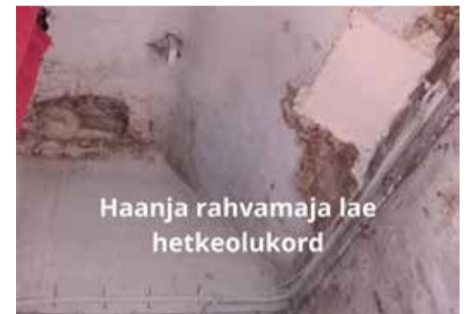
Haanja rahvamaja lava pragune seisukord

Rahvamaja lava saab uue põranda ja lavaalune soojustatud. Üks hääles klaver teeb rahvamaja väärikamaks ja Haanja laululapsed rõõmsamaks.