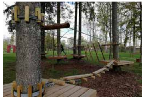
Pilt on illustratiivne

Varstu väljõusaal ja madalseikluspark. Asukoht Varstu kooli hoone ja staadioni vahetus läheduses asuv pargiala. Väljõusaalis saaksid sportlikult aega veeta nii noored kui ka vanad, madalseikluspark on tore turnimiskoht lastele.