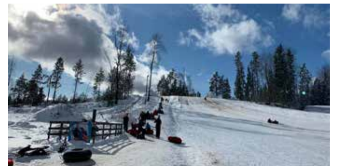
Metsavenna talu Punkrimägi ootab kelgutajaid ja tuubitajaid!

Jooksvat infot mäe lahtioleku kohta palume jälgida Metsavenna talu Facebooki lehel.