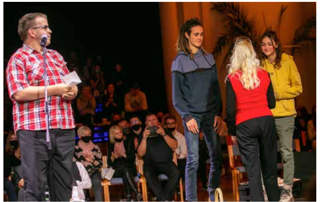
Frida ja Teodor filmifestivalil auhinda vastu võtmas.