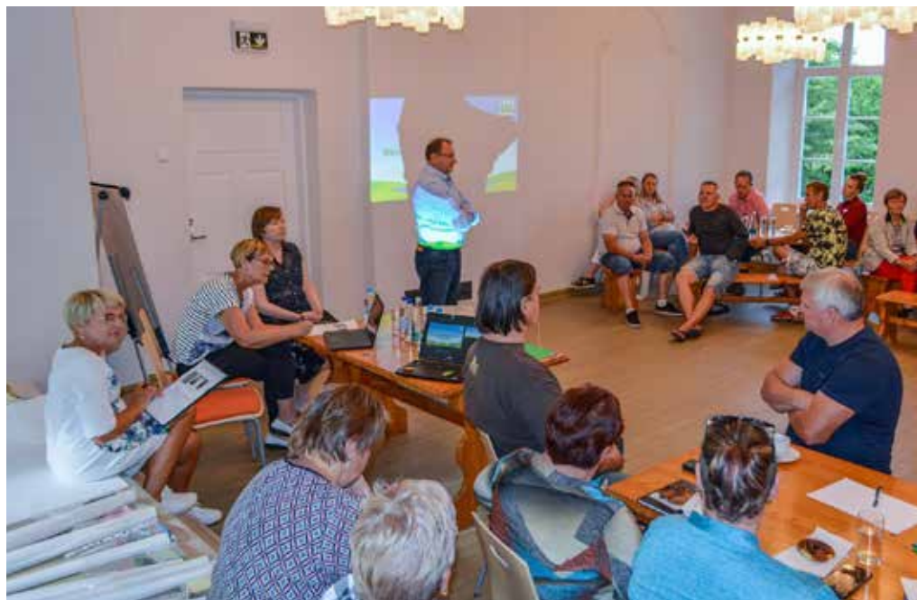
Hetk möödunud aasta 6. augustil toimunud esimesest kogukondade seminarist Viitina mõisas.