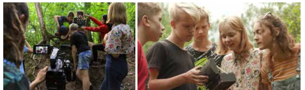
Sanna koolinoorte filmiringi töökoos.