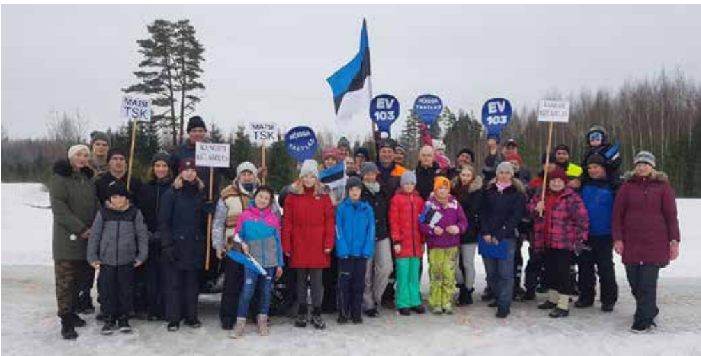
Hinge kinni pidades joosti korraks kokku ühispildile.

24. veebruari pärastlõuna möödus Kangsti piirkonna rahvale pidulikult ja sportlikult – Matsi Tehnikaspordiklubi ja Kangsti Külaseltsi korraldusel tähistati EV 103. aastapäeva ja peeti vastlaid.