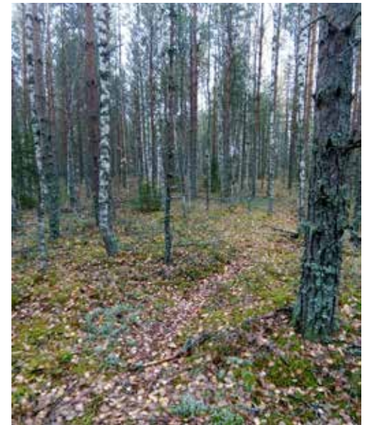
Planeeritaval kaevandusalal praegu kasvav mets.

Sänna piirkonna külade elanikud Lisainfo telefonil 521 5143 (Maarika Niidumaa)