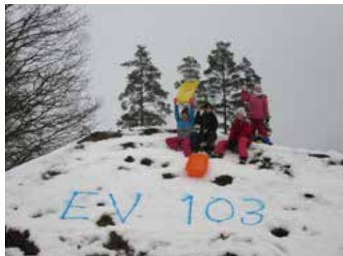
Hetki Kangsti rahva vastlapäevast.