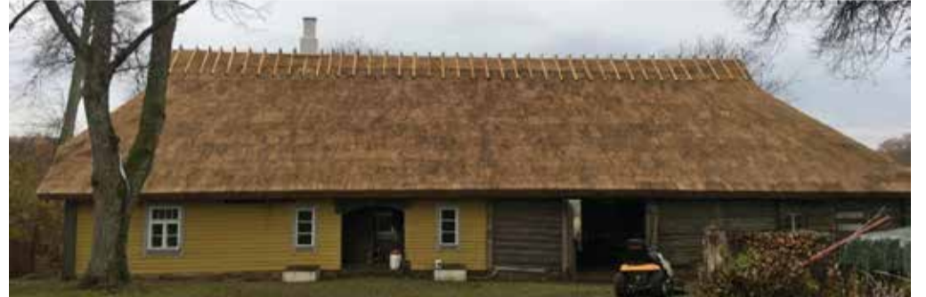
Näide toetust saanud töödest: hoone Valgemaal, toetus saadud rookatuse paigaldamiseks.

Rohkem infot leiad veebilehelt: https://www.muinsuskaitseamet.ee/et/taluarhitektuuri-toetus .