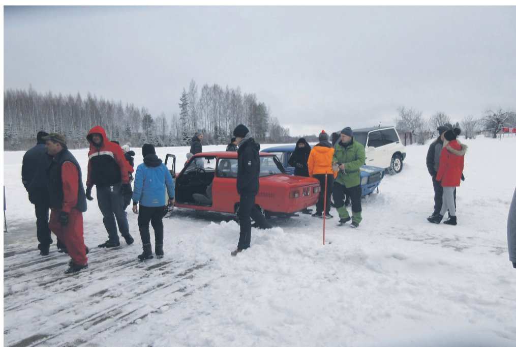
Valmistutakse ZAZ-i ja VAZ-iga sõitmiseks.

Pühapäeval, 3. märtsil toimus Matsi Tehnikaspordiklubi korraldusel meeleolukas vastlatrall Varstu piirkonna rahvale. Kohal oli 70 trallitajat – nii suuri kui väikeseid, kõige kaugemad klubi sõbrad olid kohale tulnud Soomest.