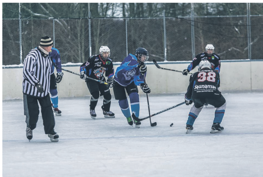
Hetk veebruarikuisele kohtumiselt HK Tartu Lionsiga Rõuge jääväljakul.

Rõuge/Vastseliina hokimeeskond osales möödunud hooajal Eesti VSÜ Jõud jäähoki meistrivõistlustel.