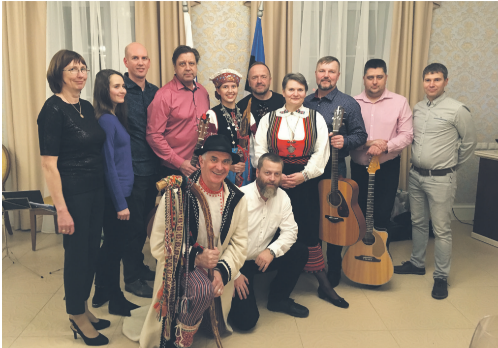
Rõuge Unistuste Kitarriorkester enne meeleolukat vastuvõttu Peterburi Peakonsulaadi Pihkva Talituses.

Rõuge Unistuste Kitarriorkester ehk lühidalt RUKO käis oma esimesel välisesinemisel Venemaal Pihkvas. Nimelt kutsus sealne Peterburi Peakonsulaadi Pihkva Talitus meid Eesti vabariigi 101. sünnipäevale pühendatud vastuvõtule tuju tõstma.