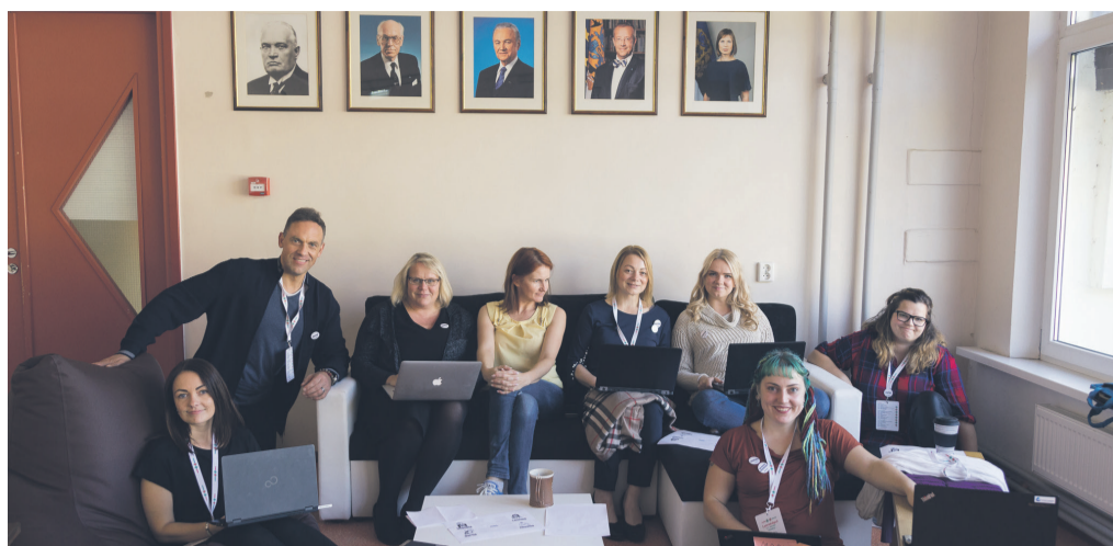
Sügisestel loometalgutel osales Rõuge vald kaugtöökeskuse Catlamaja arendamise ideega, meeskonnas löid kaasa valla töötajad ja vabatahtlikud kogukonnast, aga ka huvilised mujalt Eestist.

Selle aasta üks Võrumaa olulisemaid kogukondadele mõeldud arendusüritusi Vunki mano! loometalgud toimuvad 4.–6. aprillil Rõuge vallas Varstu koolis.