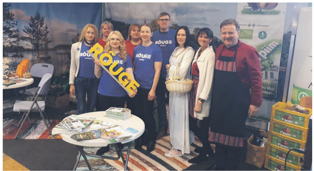
Rõuge valla ja ettevõtjate esindajad 2018. aasta Maamessil Tartus.