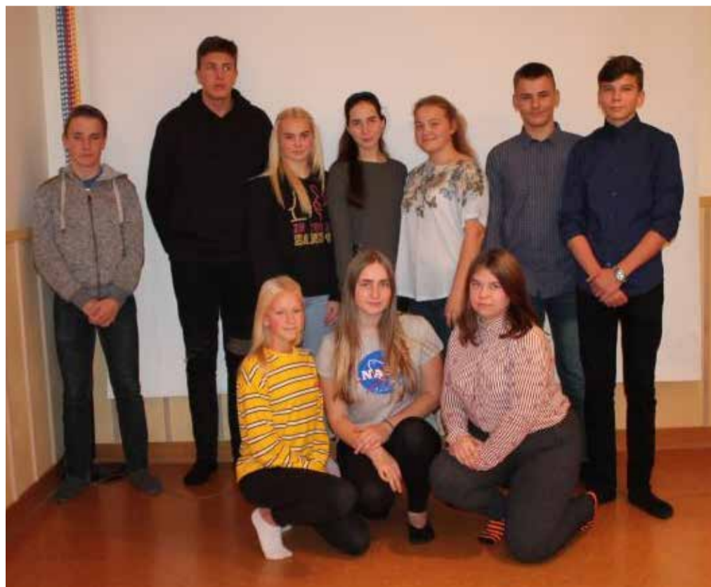
Alates tänava oktoobrist tegutseb Rõuge valla uus noortevolikogu.

Noortevolikogu tegevuse eesmärk on kaitsta noorte huvisid, korraldada ülevallalisi noorteüritusi, ellu viia omaalgatuslikke projekte ning esitada vallavolikogule ja vallavalitsusele noorte ettepanekuid.