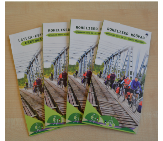
Valminud on Eesti ja Läti matkatee „Rohelised Rööpad“ trükis.