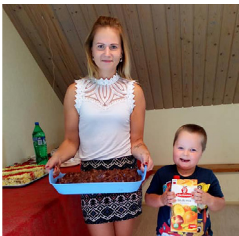
Mõniste noortekeskus pidas sünnipäeva