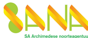
SA Archimedese noorteagentuur

Rõuge põhikoolis käivitus juuni lõpus juba seitsmes noortekohtumiste projekt. Noortekohtumine on Eestis elavate eri kultuuritaustaga noorterühmade koostööprojekt, mille töötavad välja ja viivad ellu noored ise ning mille põhitegevus on noorte omavaheline kohtumine ning noorte valitud teemaprogrammi elluviimine. Noortekohtumiste laiem eesmärk on suurendada kultuurilist teadlikkust, avatust ja sallivust nii projektis osalevate noorte puhul kui ka ühiskonnas tervikuna. Kuna noortekohtumisel tegutsevad erisuguse kultuuritaustaga ja eri keelt kõnelevad noored üheskoos, pakub see head võimalust tutvuda lähemalt üksteise kultuuridega (nii ajaloo kui ka tänapäevaga) ning teineteist paremini tundma ja mõistma õppida.