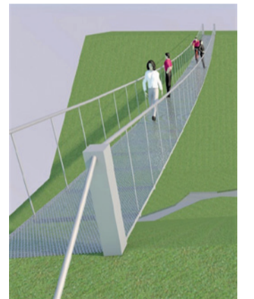
Rippild üle Ööbikuoru. Väljavõte projektist, autor Karmo Tõra