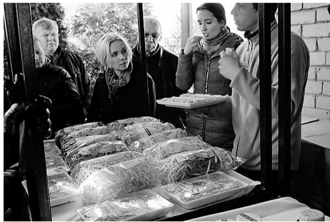
Mentorklubi reisiseltskond SIA Siera Ražotne toodangut mekkimas.

Järgmiseks jõudisime kohta, kus meid ootasid aedikus metsikud hobused ning elajas, nagu giid teda nimetas. Küll üritati bussiaknast loomakeste sugu määrata ja tema üle nalja visata, aga elajaks ta jäigi. Olime jõudnud bioma-japidamisse „Jaun-Ievinas“, kus pakuti lõunasööki, peremees tutvustas majapidamist ja perenaine pakkus