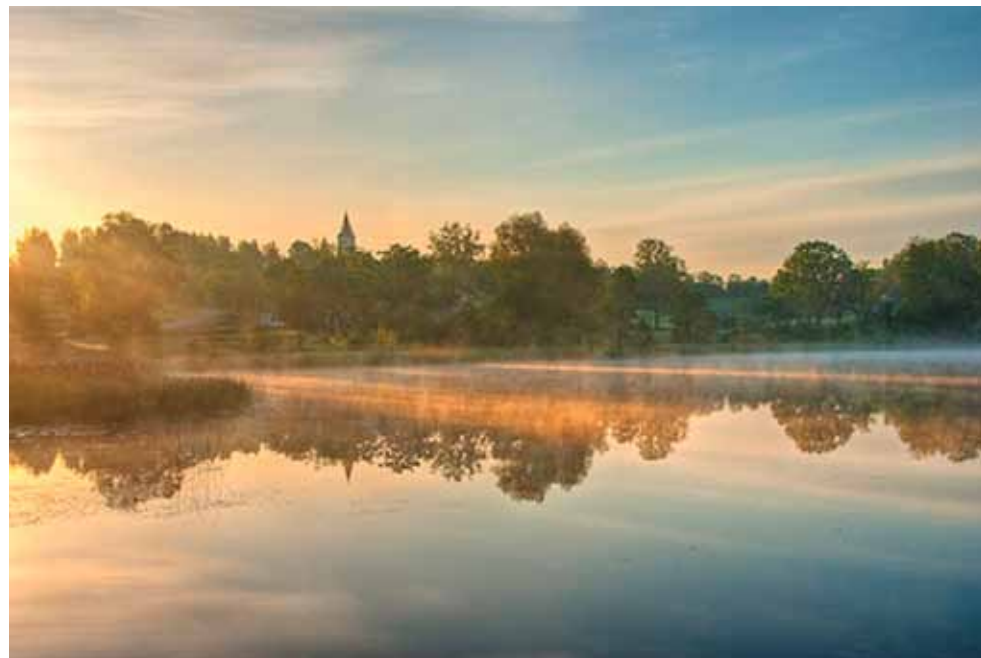
Müstiline Rõuge Suurjärv suvehommikuses udus.

On kindlaks tehtud, et iga inimese nahal on baktereid sama palju kui maakeral inimesi. Bakterid toituvad meie energiast ja kaitsevad meid. Alasti supeldes läheb osa baktereid kehapiinalt maha ja inimesel jääb ener-