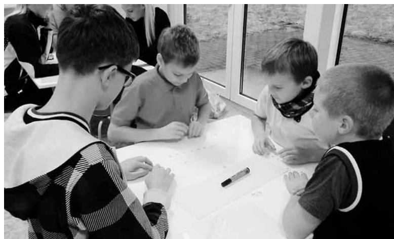
Rõuge Põhikooli meeskond Rõuge Robot Team.

Selle hooaja FLL võistluse teemaks on „Prügi rännak“. Nii kohtusidki meeskonnad viiest Võrumaa koolist – Haanja, Rõuge, Krabi, Pikakannu ja Võru Kreutzwaldi koolist – just jäätmekke vähendamise nädalal, et rääkida prügist