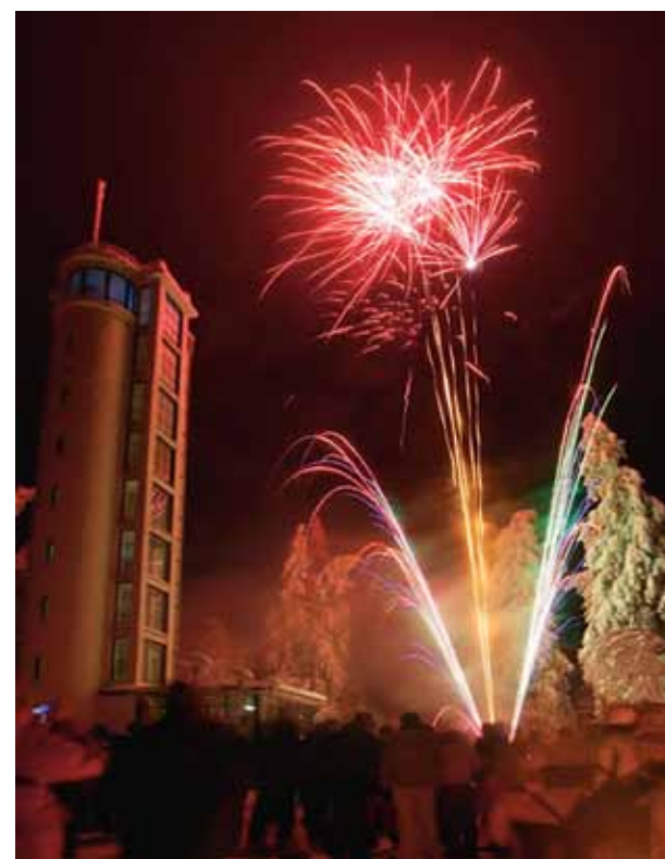
Head Haanja ja Rõuge valla elanikud! Soovime ...

jõulurahu, soojust, valgust, hingerahu, kirkast algust! Kauneid hetki, kalleid palju, Vahvaid retki, rõõmsaid nalju! Lõbusat lõppu vanale ja asjalikku algust uuele! Haanja Vallavolikogu Haanja Vallavalitsus