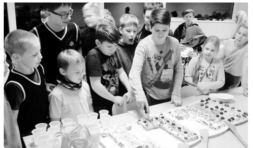
Tordi pidulik lahtilõikamine. Esiplaanil Võru Kreutzwaldi Kooli meeskonnaliikmed.

Haanja ja Rõuge robotikatime koostöö on tihe ja sõbralik, ühiseid ettevõtmisi saab juba terve hulga loetleda. Näiteks sellesügisese programmeerimise nädala Code